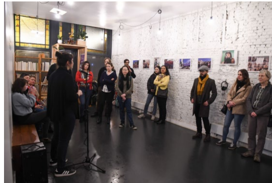
Opening Mundana VZW Antwerpen Maart 2020